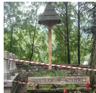
Grób Stanisława Witkiewicza na Pęksowym Brzyzku

Zwiedzanie Zakopanego rozpoczęliśmy od odwiedzenia willi „Koliba” – pierwszego budynku zbudowanego w stylu zakopiańskim – oczywiście wg projektu Stanisława Witkiewicza.