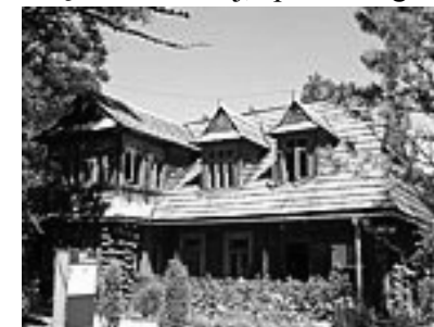
Willa „Atma” w Zakopanym

Następnie udaliśmy się ulicą Koście-liską na zabytkowy Cmentarz na Pęksowym Brzyzku, gdzie spoczywa wiele zasłużonych dla Tatr i Podhala osób. Po zwiedzeniu cmentarza weszliśmy do drewnianego kościółka p.w. Matki Boskiej Częstochowskiej, pierwszego kościoła parafialnego w Zakopanym.