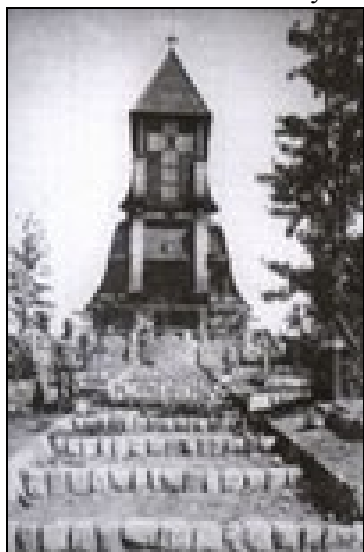
Nieistniejąca już kaplica „gontyna” na szczycie Góry Pustki

Na koniec zatrzymaliśmy się u stóp Góry Pustki (406 m n.p.m.), na