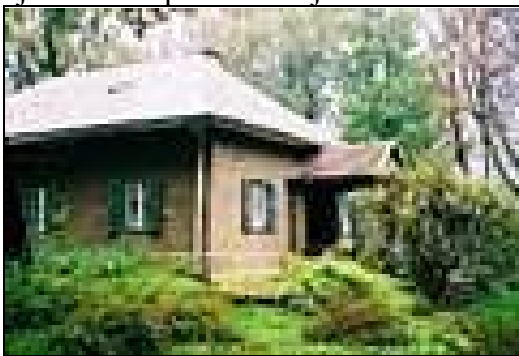
Dawna plebania w Grybowie - obecnie Muzeum Parafialne

Wielkiego w 1340r., na skrzyżowaniu szlaków handlowych na Ruś i Węgry. Zwiedziliśmy starą Plebanię pochodzącą z 1699r., posiadającą bogate zbiory sztuki kościelnej. Obecnie pełni funkcje Muzeum Parafialnego. Wśród eksponatów na uwagę zasługują: gotycki obraz św. Zofii z córkami z ok. 1460r. oraz późnogotycki obraz Świętej Rodziny. Znajduje się tu wiele rzeźb i wyrobów rzemiosła artystycznego, między innymi naczynia liturgiczne. |