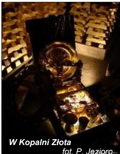
W Kopalni Złota