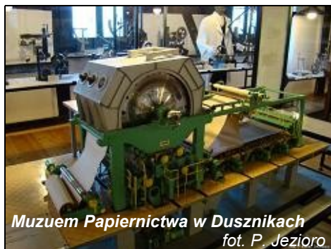
Muzeum Papiernictwa w Dusznikach

Po opuszczeniu urokliwych Gór Stołowych udaliśmy się do Wambierzyc, zwanych śląską Jerozolimą. Jest to wieś o zabudowie przypominającej miasteczko, a centralne miejsce zajmuje barokowa Bazylika p.w. Nawiedzenia NMP z XVIII w. Niedaleko kościoła mieści się sławna, zabytkowa szopka z 800 figurkami, w tym 500 ruchomymi. Jest to dzieło miejscowego cieśli Wittiga. Cały układ Wambierzyc z licznymi kaplicami, krzyżami, stacjami kalwaryjskimi i figurami na okolicznych wzgórzach nawiązuje do historii biblijnej.