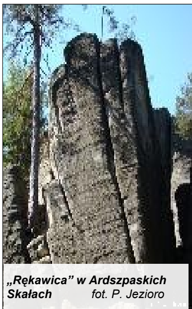
„Rękawica” w Ardszpaskich Skalach

Ostatni dzień rozpoczęliśmy od zwiedzania czeskiej części Gór Stołowych - Skalnego Miasta w Skalach Adrspaskich. Płynęliśmy również łódką po jezioru zamkniętym pomiędzy stromymi skałami.