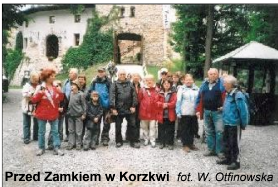
Przed Zamkiem w Korzkwi

Na początek odwiedziliśmy kolejną jurajską warownię – pięknie odrestaurowany, XIV-wieczny Zamek