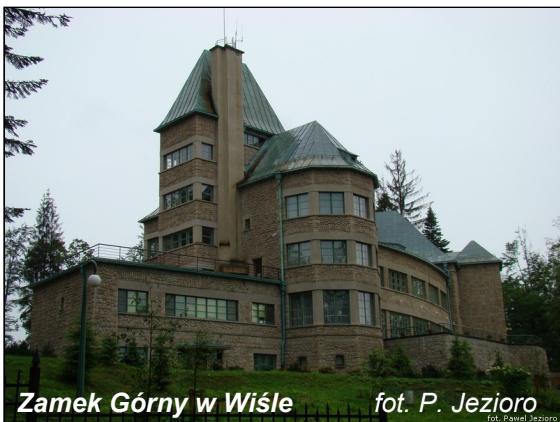
Zamek Górny w Wiśle

Byliśmy także w kościele katolickim p.w. Dobrego Pasterza. Znajduje się on w centrum wsi, zbudowany w latach 1792-1794, na miejscu drewnianej kaplicy. Rozbudowany w latach 1928-1929 przybrał obecny kształt. W nawie głównej powstały wówczas polichromie i freski przedstawiające między innymi: Piekło i Niebo, autorstwa istebniańskich artystów: L. Konarzewskiego i J. Wałacha. W ołtarzu głównym znajduje się obraz Chrystusa na Krzyżu w rozmowie z Dobrym Łotrem. Ciekawe są: ambona w kształcie łodzi i chrzcielnica w kształcie muszli.