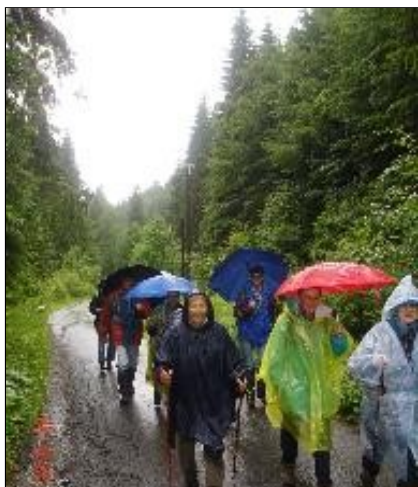
W drodze do schroniska fot. K. Barwacz

Na początek pojechaliśmy na przełęcz Kubalonka, gdzie 14 dzielnych śmiałków, na czele z przewodnikiem Krzysztofem Szafranem udało się na pieszą wycieczkę w kierunku Baraniej Góry (1220 m n.p.m.) – drugiego, co do wysokości szczytu polskiej części Beskidu Śląskiego.