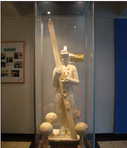
Pomnik Adama Małysza z białej czekolady w Wiśle

towarzyszył nam deszcz o różnym natężeniu. Zadowoleni, choć zmoknięci wróciliśmy do Krakowa.