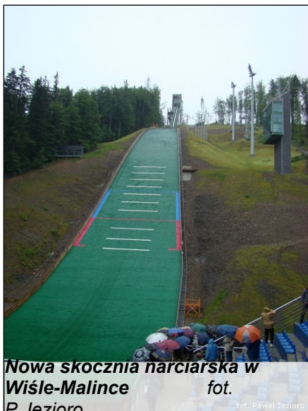
Nowa skocznia narciarska w Wiśle-Malince

W kierunku Wisły pojechaliśmy przez znajdującą się na wysokości 761 m n.p.m. przełęcz Kubalonka, z której zjechaliśmy do Wisły Czarnego, obok Zameczku Prezydenta. Zamek wybudowany został w latach 1921-1931 według projektu A. Szyszko-Bohusza. Był darem ludu śląskiego dla Ignacego Mościckiego.