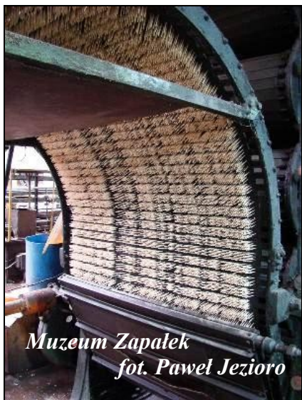
Muzeum Zapalek

W drodze powrotnej z Rezerwatu wstąpiliśmy do Archikatedry p.w. Św. Rodziny w Częstochowie. Jest to neogotycka świątynia, jedna z największych