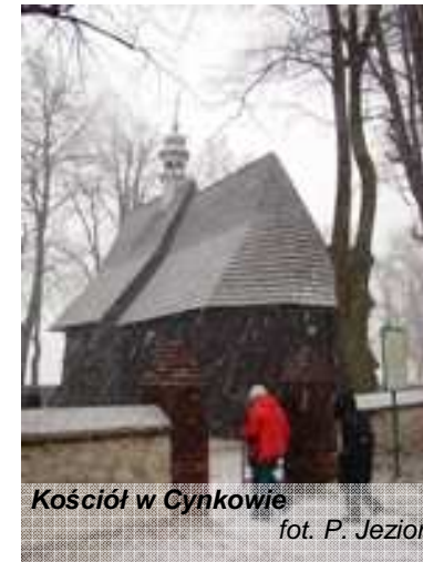
Kościół w Cynkowie

W Koziegłówkach odwiedziliśmy zbudowane w latach 1903-1908 wg planów inż. J. Pomianowskiego Sanktuarium Św. Antoniego. Kościół murowany w stylu włoskiego renesansu, front zdbi wieża z kolumnadą. Jest podzielony dziesięcioma filarami na trzy nawy, dzięki czemu całość ma kształt krzyża łacińskiego.