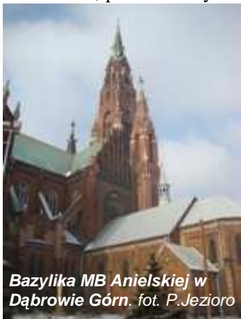
Bazylika MB Anielskiej w Dąbrowie Górn.

Dąbrowa Górnicza – miasto położone w Zagłębiu Dąbrowskim nad rzeką Przemszą. Zwiedzanie rozpoczęliśmy od Bazyliki Matki Boskiej Anielskiej, która jest Sanktuarium Diecezji Sosnowieckiej.