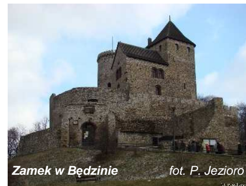
Zamek w Będzinie

Naszym następnym celem był Będzin - 60 - tysięczne miasto, położone na Wyżynie Śląskiej nad rzeką Czarną Przemszą. Zwiedzanie rozpoczęliśmy od zamku królewskiego wzniesionego w miejscu wcześniejszego wiślańskiego grodu na Górze Zamkowej. Najstarszym XIII w. elementem warowni jest cylindryczna wieża, do której w połowie XIV w. za panowania Kazimierza Wielkiego, dobudowano budynek mieszkalny, oraz dwa pierścienie murów, okalające niewielki dziedziniec, tworząc w ten sposób tzw. Zamek Górny. Następnie wzniesiono Zamek Dolny, którego mury łączyły się z kamiennymi murami otaczającymi całe miasto.