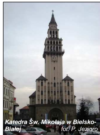
Katedra Św. Mikołaja w Bielsko-Białej