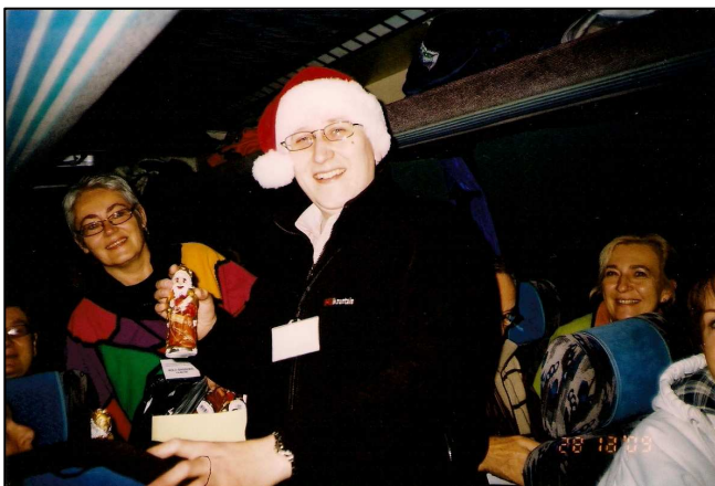
Mikołajowe niespodzianki w autokarze

Cała wycieczka była bardzo udana, nawet pogoda nam dopisała, były liczne przebłyski słońca. Pani przewodnik oddała nam całą swoją uwagę i czas, zadbała o liczne niespodzianki. Zadowoleni wróciliśmy do Krakowa. ◀▶